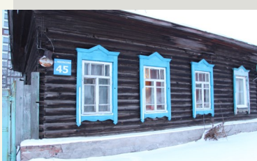
Проект учеников гимназии №13 «ПУТЕВОДНАЯ НИТЬ»