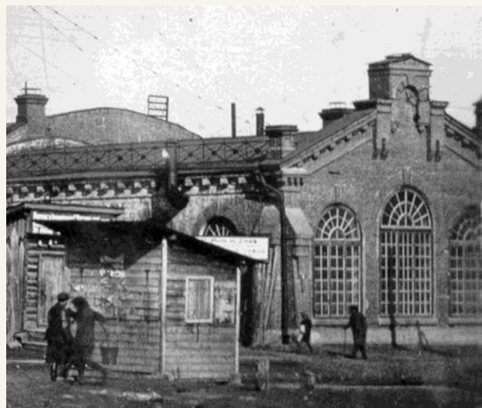
Парфюмерно-мыловаренная фабрика (масложировой комбинат)